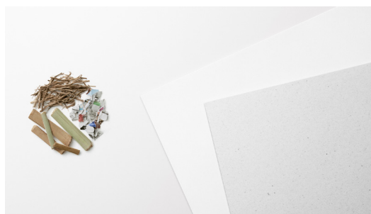
原材料とオリジナルブレンドマテリアル

* オリジナルブレンドマテリアルの詳細は、ソニーのウェブサイトをご参照ください。