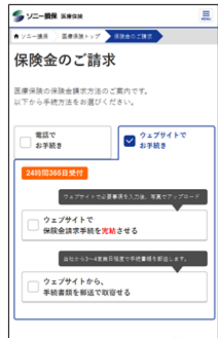
保険金請求の手続方法を 選択するページ (画面抜粋)

最初に、保険金請求の手続方法を、電話・ウェブサイトのいずれかから選択していただきます。