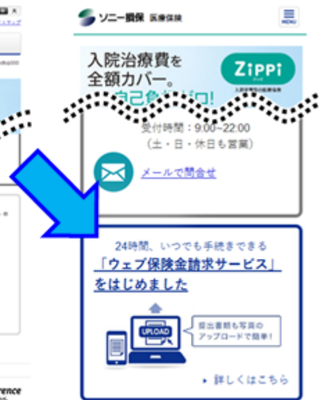
医療保険紹介ページトップ (スマートフォン画面抜粋)