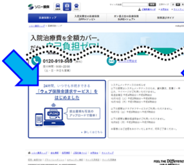
医療保険紹介ページトップ (PC画面抜粋)

保険金請求手続のページには、PC、スマートフォンいずれも、医療保険紹介ページのトップページからアクセスできます。