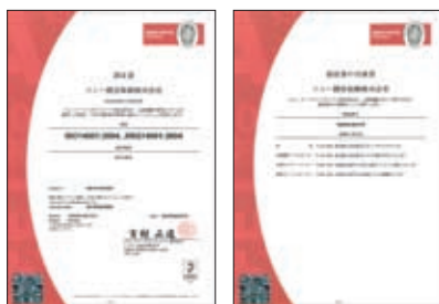
ISO14001認証書・認証書の付属書

ソニー損保を含むソニーグループでは、全世界共通の環境マネジメントシステム(Global Environmental Management System)にて環境活動を行っており、国際規格であるISO14001のグローバル統合認証を取得しています。ソニー損保では、本社、蒲田、大阪および札幌の主要4事業所をISO14001の認証対象としており、電力使用量およびコピー用紙使用量の低減目標値を定めた省エネ・省資源活動や、事務用品におけるエコ商品比率を高めるグリーン購入の推進を行っています。