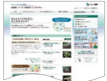
エコロジーサイト内 みんなのぶちECO コーナーのトップ画面

*エコロジーサイトでは、ソニー損保の環境保全への取り組みなども紹介しています。 ☞エコロジーサイトについては、13ページをご参照ください。