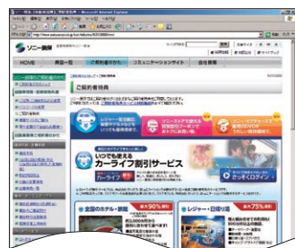
ご契約者特典の紹介ページ

レンタカーやカー用品、駅・空港の駐車場のほか、レジャー施設・日帰り入浴施設など、カーライフに関連するさまざまなメニューを優待価格でご利用いただけます。また、国内外の宿泊施設やグルメチケットなどの割引サービスなども提供しています。