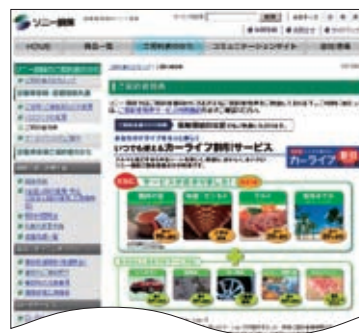
ご契約者特典の紹介ページ

住宅ローン金利優遇や海外航空券、フラワーギフトの割引などを、提携企業から提供しています。