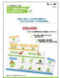
住宅ローン専用長期火災保険商品パンフレット

*家財・地震の保険期間は最長で5年です。 5年経過後は、建物の基本補償の保険期間満了まで更新が可能です。