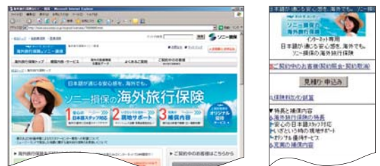
海外旅行保険のウェブサイト画面 (左:パソコン 右:携帯電話)

*海外旅行保険は、ジェイアイ傷害火災保険株式会社との提携商品です。ご契約者には、現地の「Ji デスク」などを通じて日本語でもさまざまなサポートを提供します。