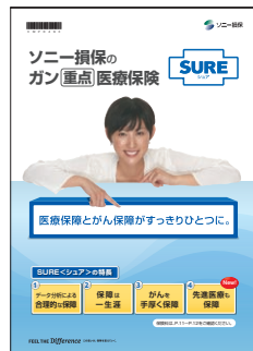
ガン重点医療保険SURE<シュア> 商品パンフレット