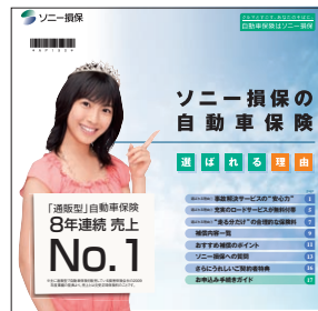
自動車保険 商品パンフレット

保険の真価を問われる万一の事故などの時にも、お客様に安心していただけるよう、補償を充実させています。