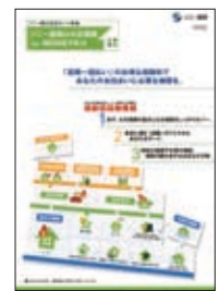
住宅ローン専用長期火災保険商品パンフレット

*海外旅行保険は、ジェイアイ傷害火災保険株式会社との提携商品です。ご契約者には、現地の「Ji デスク」などを通じて日本語でもさまざまなサポートを提供します。