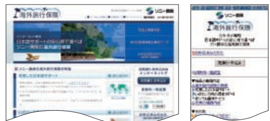
海外旅行保険のウェブサイト画面 (左:パソコン 右:携帯電話)

*詳しい商品内容は、商品パンフレットやウェブサイトなどで紹介しています。実際にご契約いただく際は、必ず詳細を商品パンフレットや重要事項説明書等でご確認ください。