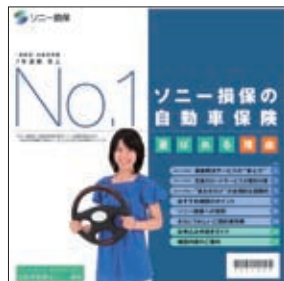
自動車保険 商品パンフレット

保険の真価を問われる万一の事故などの時にも、お客様に安心していただけるよう、補償を充実させています。