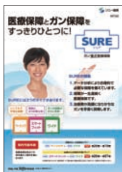
ガン重点医療保険SURE〈シュア〉 商品パンフレット

なお、同特約については、保険始期日から1年間は保険金のお支払いの対象外となります。