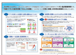
ガン重点医療保険SURE(シュア)のパンフレット

また、お客様に直接郵送でお送りするパンフレットでは、ソニー損保が提供する商品やサービスの特長などを、お客様が1人でお読みになってもご理解いただけるよう、お伝えする情報の内容のほか構成などにもこだわり、わかりやすさの向上に努めています。