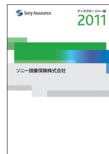
ディスクロージャー誌2011表紙

ディスクロージャー誌は、多くの方にご覧いただけるよう、ウェブサイトにも掲載しています。