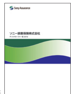
ディスクロージャー誌2010表紙

ディスクロージャー誌は、多くの方にご覧いただけるよう、ウェブサイトにも掲載しています。