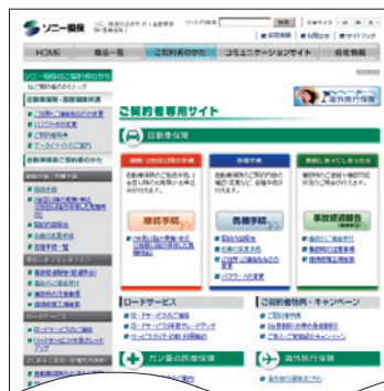
ご契約者専用サイト トップページ