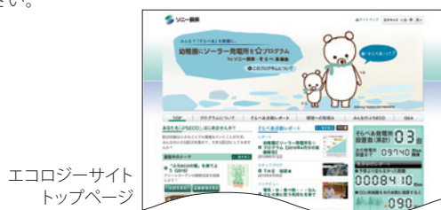
エコロジーサイト トップページ

☞「幼稚園にソーラー発電所を☆プログラム」の詳細については38ページをご参照ください。