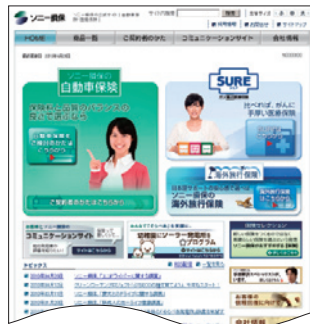
ソニー損保のウェブサイト トップページ

自動車保険やガン重点医療保険SURE(シュア)などの、商品やサービス内容に関する情報を提供しています。ウェブサイトの使いやすさの向上や機能の充実にも継続的に取り組み、随時改善を図っています。