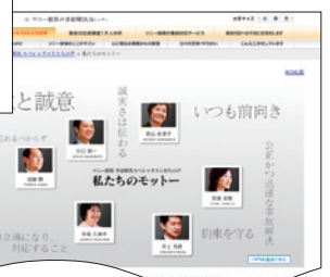
ソニー損保の事故解決力紹介ページ