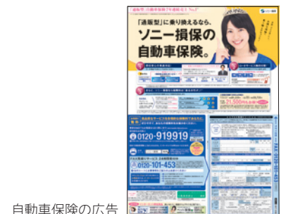
自動車保険の広告

広告では、掲載スペースやコマーシャルの長さなどに応じて的確に情報をお伝えできるよう努めています。また、主に郵送でお届けしているパンフレットでは、商品開発担当者や実際に現場でサービスを提供するスタッフの取組みを紹介したり、ソニー損保が提供する商品やサービスの特長を、各種統計をもとにした客観的なデータを使用したりすることで、わかりやすくお伝えできるよう努めています。