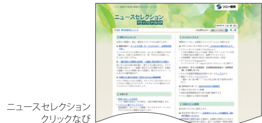
ニュースセレクション クリックなび

「お客様とソニー損保のコミュニケーションサイト」や「エコロジーサイト」の更新情報に加え、ご契約者特典や各種キャンペーン情報など、さまざまなコーナーの情報をコンパクトにまとめ、随時更新しています。